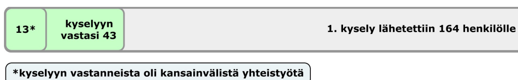
Kuvio 1: Ensimmäiseen (laajaan) kyselyyn vastanneiden ja kansainvälistä yhteistyötä tehneiden määrä

Aineistoa kerättiin kentän toimijoilta kahden kyselyn avulla sekä tiedustelemalla asiaa rahoittajatahoilta tai rahoitusta kanavoivilta tahoilta sekä alalla toimivilta katto-organisaatioilta. Kyselyistä ensimmäinen, jolla pyrittiin selvittämään yleisesti, kuinka laajalti kansainvälisten hankkeita toteutetaan ja jos ei toteuteta, miksi ei, lähetettiin 164 henkilölle. Vastauksia tuli 43 eli vastausprosentti oli vain 26,2 %. Toinen kysely lähetettiin 13 organisaatioon, joilla on ensimmäisen kyselyn perusteella kokemusta kansainvälisestä yhteistyöstä. Kyselyllä selvitettiin kansainvälisen yhteistyön haasteita, hyötyjä ja kehittämiskohteita. Vastauksia saatiin 10.